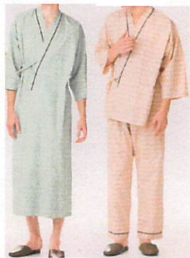
患者衣 ガウン 甚平 サイズ(S・M・L・LL・3L)