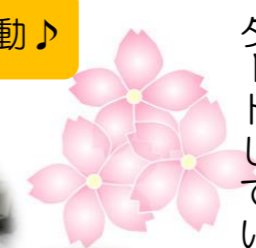
パッと笑顔の花が咲く♪

ハートフル林(二階・四階)には、各九名の方が住んでおられます。それぞれの個性を大切に、笑いの絶えぬ日々を過ごしております。行事なども充実しており、春の陽気に誘われてのお花見、夏は焼肉でグッと一杯、秋はコスモス狩り、冬は理事長サンタがやってきました♪今年が酉年、初詣から楽しい一年がスタートしています。