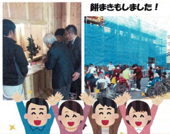
餅まきもしました！

9月の地鎮祭が行われてから約3ヶ月。 本日(12/18)は現在建設中のグループのホームの上棟式でした。 雨を心配しましたがお天気も回復し、無事に上棟式、お餅撒きを執り行うことができました。 上棟式後は最近では少なくなったお餅撒きを行い、近所の方々やお子様たち、入院患者さん、施設の入居者のみなさんなど、多くの方々にご参加頂き、にぎやかなイベントとなりました。完成は来年の5月です。楽しみです。